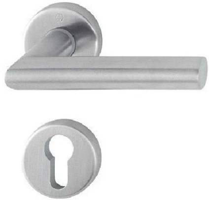
KOVÁNÍ DVEŘÍ (REF. VÝROBEK HOPPE AMSTERDAM)